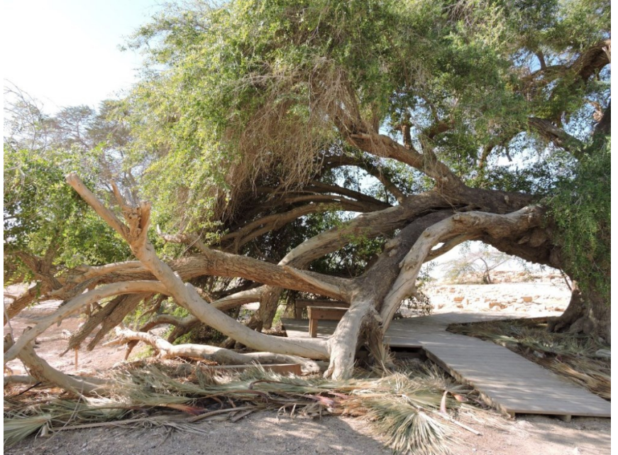
שיזף מצוי בעין חצבה, שגילו 600–2,000 שנים – המועמד המוביל לתואר העץ העתיק ביותר בישראל