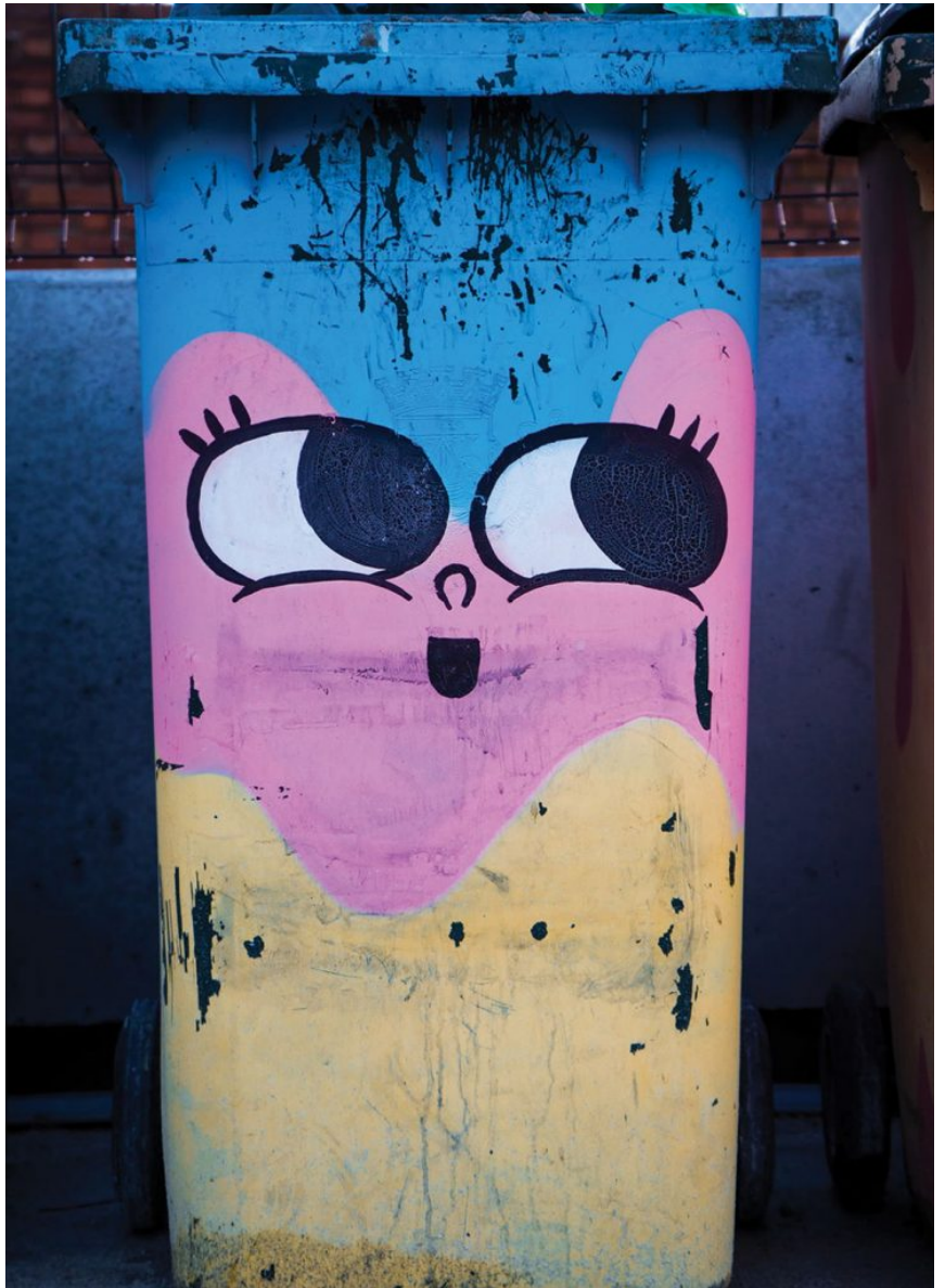
משק הפסולת הישראלי נמצא בפער גדול ביחס לנעשה במדינות מפותחות | צילום: Alberto Frías, Unsplash

מאז שנת 2018 מקדם המשרד להגנת הסביבה מדיניות פסולת עתירת הון, המבוססת על טכנולוגיות של שרפה והשבת אנרגיה מהפסולת. המשרד לא הציג ניתוח מיטוב (אופטימיזציה) של התוכנית, ולכן לא ברור כיצד נקבע שהפתרון המיטבי הוא זה ולא אחר. זאת ועוד, משרפת פסולת היא אמצעי ולא מטרה, ופסולת המיועדת לשרפה חייבת להיות פסולת שיורית שלא ניתן להפיק ממנה ערך כלשהו מלבד האנרגיה שבשרפתה. המדיניות, כפי שהיא מוצגת כיום, צפויה לאפשר בניית מספר מתקני שרפת פסולת עירונית ואף מתקן לשרפת פסולת פלסטיק. כרגע המדינה אומנם בוחנת מחדש את המדיניות, אך עקרונות קרן הניקיון כבר אישרה מימון להקמת שלושה מתקני שרפת פסולת בעלי קיבולת שנתית של כ-550 אלף טונות פסולת, שהן כ-3.3 מיליון טונות פסולת בשנה לפני מיון למתקן, וזאת בהנחה שיכולות המיון יעלו ל-50%. המשרפות זקוקות לפסולת בעלת ערך קלורי גבוה, לחוזים ארוכי-טווח שיאפשרו אספקה רציפה של פסולת ועוד. היבטים אלה בהחלט עלולים להעמיד בסיכון עמידה ביעדי המחזור שישראל קבעה לעצמה. יש להזכיר כי דירקטיבת הפסולת האירופית (משנת 2018) קוראת לצמצום שרפת פסולת, למחזור פסולת ולהפרדה במקור [1] . גם החלטת הפרלמנט האירופי ממאי 2020 באשר להשקעות בנות-קיימא קוראת למינימום השקעות במתקני שרפה [2] .