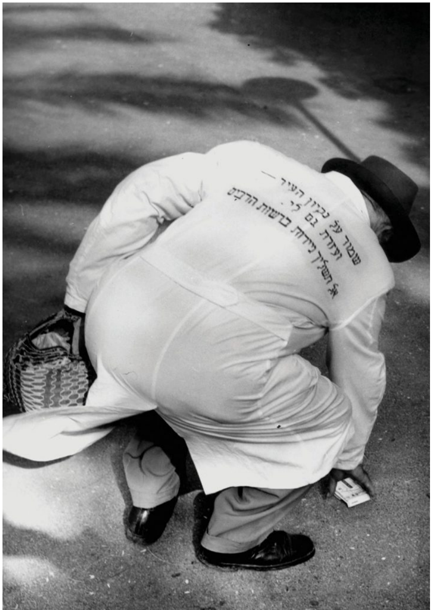
עובד ניקיון בתל-אביב, 1950