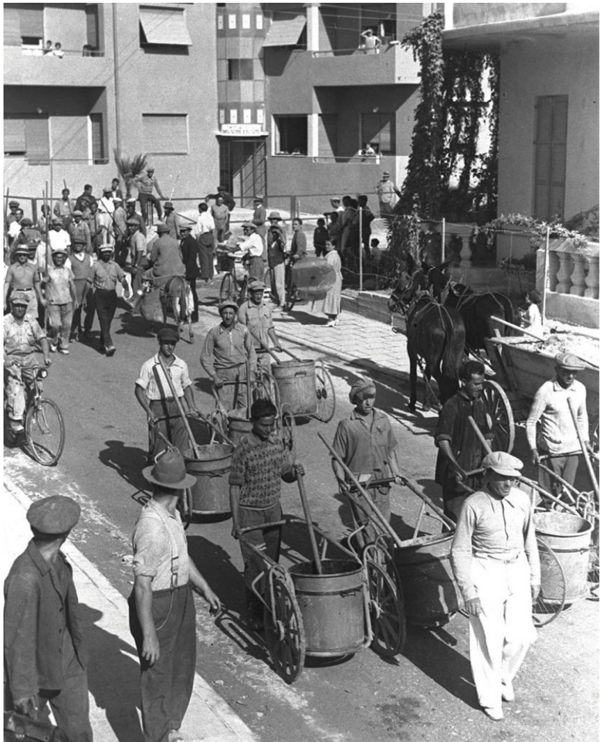
עובדי תברואה יוצאים לעבודתם ברחובות תל-אביב, 1934

גילה פיתחה את המושג "משטר פסולת" כדי לאפיין באופן הרחב ביותר כיצד חברה מייצרת פסולת ומתמודדת עימה מבחינה חומרית וטכנית ומבחינה תרבותית וסמלית. המסגרת שהציעה גילה גובשה בתוך מדעי החברה, ולפיכך אינה מאמצת מונחים מהעגה המקצועית של תחומים כמו ניהול פסולת או כלכלת הסביבה. המסגרת מאפשרת להתבונן בעבר באופן מורכב: במקום לבחון עד כמה התקרבו לפרדיגמה השולטת כיום, ניתן לזהות מספר דרכים לארגון האשפה ולהתמודדות עימה. בכל אחת מהגישות הכתיבו שיקולים שונים את סדרי העדיפויות בטיפול באשפה, והובילו ליתרונות, לחסרונות ולתוצאות מפתיעות ולעיתים אף סותרות.