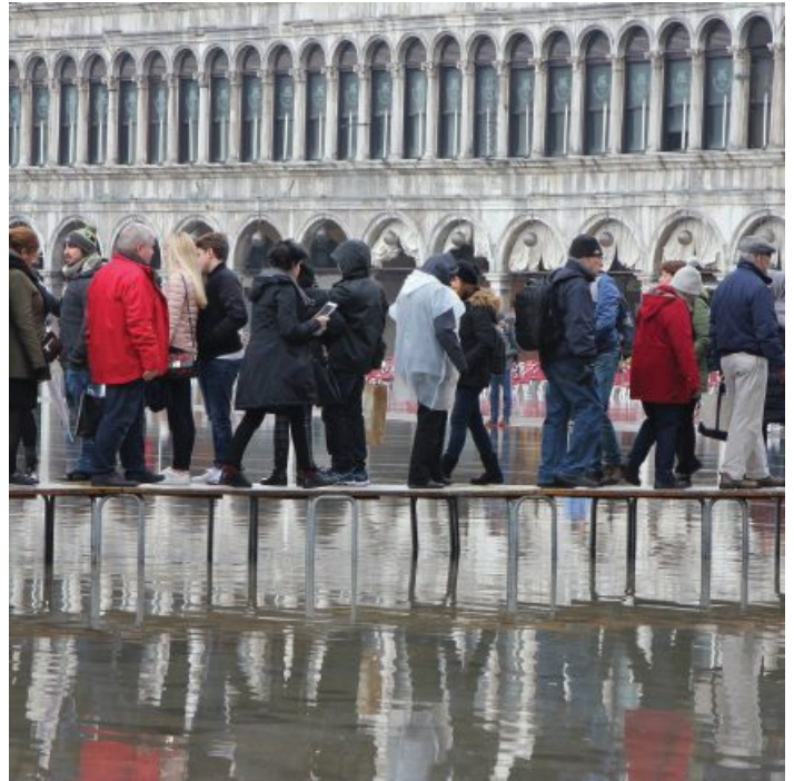
הצפות בכיכר סן מרקו בוונציה. נובמבר 2019

המרכיבים הללו מדגימים כי השגת חוסן עירוני היא משימה רב-תחומית, שמשלבת בין תכנון פיזי, ניהול ותחזוקה, עבודה חינוכית וקהילתית, איסוף וניתוח של נתונים ואיגום משאבים. כל אלה תלויים במנהיגות המקומית, שבמצמה ניצבת במבחן פוליטי בעת אסון, כאשר האצבע המאשימה של הציבור מופנית לעיתים קרובות לשלטונות ולא לגורמים מעורפלים יותר כמו "שינוי האקלים" [27].