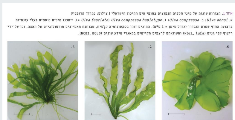
איור 1. תצורות שונות של מיני חסנית הנפוצים בחופי הים התיכון הישראלי א. Ulva ohnoi ; ב. Ulva compressa ; ג. Ulva compressa haplotype ; ד. Ulva fasciata . ייתכנו מינים נוספים בעלי עונתיות ברצועת החוף שטרם הוגדרו (גודל סימן = 1 ס"מ). המינים זוהו בטקסונומיה קלסית, שבוחנת מאפיינים מורפולוגיים של האצה, וכן על-ידי ריצוף שני גנים (RbcL, tufA) והשוואתם לרצפים הקיימים במאגרי מידע שונים (NCBI, BOLD).

החסנית שייכת למשפחת הירוקיות (Chlorophyta) ונפוצה במרבית האוקיינוסים בעולם. בשנת 2002, בעקבות בחינה מחדש באמצעים מולקולריים, צורפו הסוגים חסנית ( Ulva ) ופרשדונית ( Enteromorpha ) לסוג אחד, הקרוי חסנית וכולל כ-600 מינים. מבנה החסנית פשוט, והיא מורכבת ממספר עלים הגדלים מבסיס יחיד (ומכונים יָצֵע [thallus], איור 1). בדומה לכל מְקָרו-אצה, לחסנית אין מערכות הובלה ושורשים כפי שניתן למצוא בצמחים עילאיים. לחסנית שימושים תעשייתיים רבים, כגון בתהליכי סינון ביולוגי, כמקור למזון בחקלאות ימית משולבת וכמקור לתזונת האדם (בעיקר במדינות אסייתיות). לאחרונה נבחנה החסנית כחומר גלם ליצירת דלקים ביולוגיים בהתססה. רוב מיני החסנית גדלים באזור הגאות והשפל (איור 2) ועד עומק של מטרים בודדים. באמצעות מאפיינים מורפולוגיים ומולקולריים ששימשו במחקר זה ובמחקרים קודמים בחקר ימים ואגמים אנו מעריכים שישנם בחופי הים התיכון הישראלי לפחות ארבעה או חמישה מינים של חסנית, מתוכם שלושה מינים זהו באופן ודאי (איורים 1א, 1ב, 1ג).