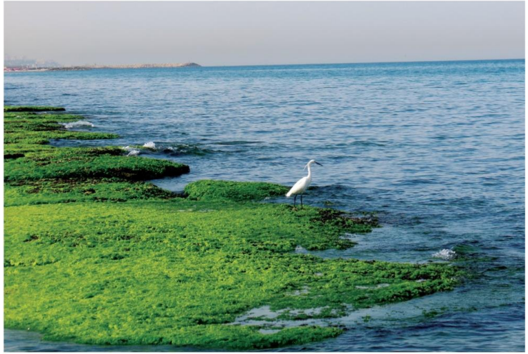
איור 2 מראה אופייני של פריחת חסנית בטבלאות גידוד בתקופת האביב. חוף תל ברוך, מרץ 2015 | צילום: גלית צלרמאיר

איור 2. מראה אופייני של פריחת חסנית בטבלאות גידוד בחקופת האביב. חוף תל ברוך, מרץ 2015 | צילום: גלית צלרמאיר